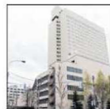
9 当ホテルに到着です。