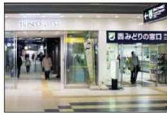
2 PASEO WESTの「西みどりの窓口」左横通路を直進してください。