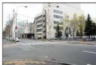
8 高架下通路を出ましたら、横断歩道を渡って下さい。