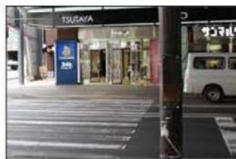
5 出口すぐ正面の交差点を渡ります。