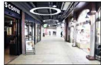
3 「西みどりの窓口」左横通路内です。まっすぐお進みください。