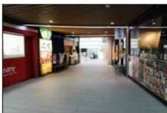
4 スロープを進むと、JR札幌駅構内出口です。