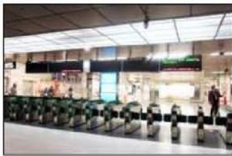
1 JR札幌駅の西改札口を出てください。