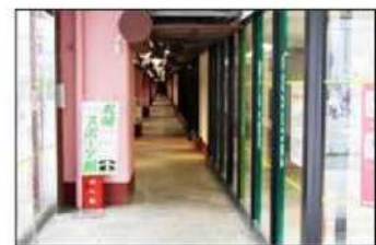
6 「TSUTAYA」の看板の奥にある高架下通路を直進してください。