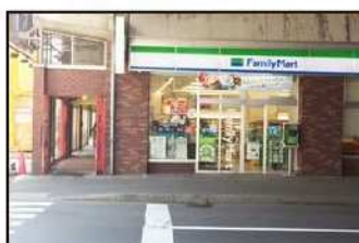
7 高架下通路を出ましたら交差点を渡り、「ファミリーマート」の左横の高架下通路を直進してください。